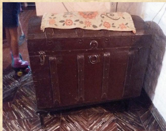
Baúl que usaron para el viaje transoceánico.

También relataba que debía ser bautizado en la parroquia de Moclinejo (puesto que tenía competencia respecto del Lagar “Los Palmas”) sin embargo, su padre decidió bautizarlo en Benagalbón a consecuencia de una pelea que tuvo con el párroco de Moclinejo.