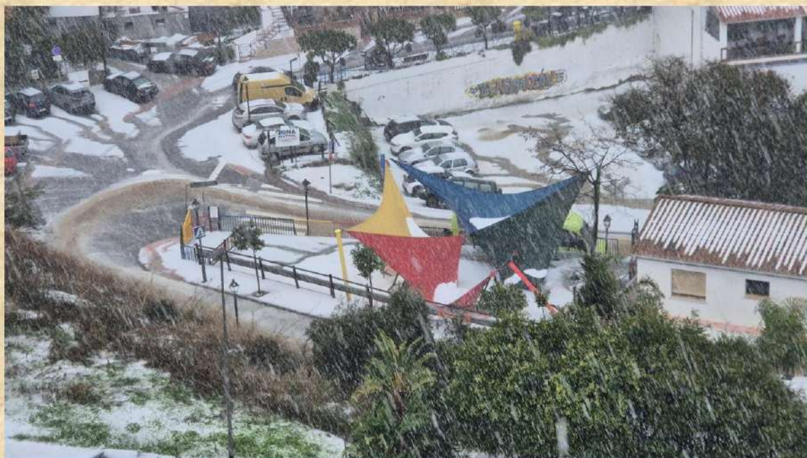
Imagen de la entrada de Benagalbón en el momento en que descargaba la tormenta