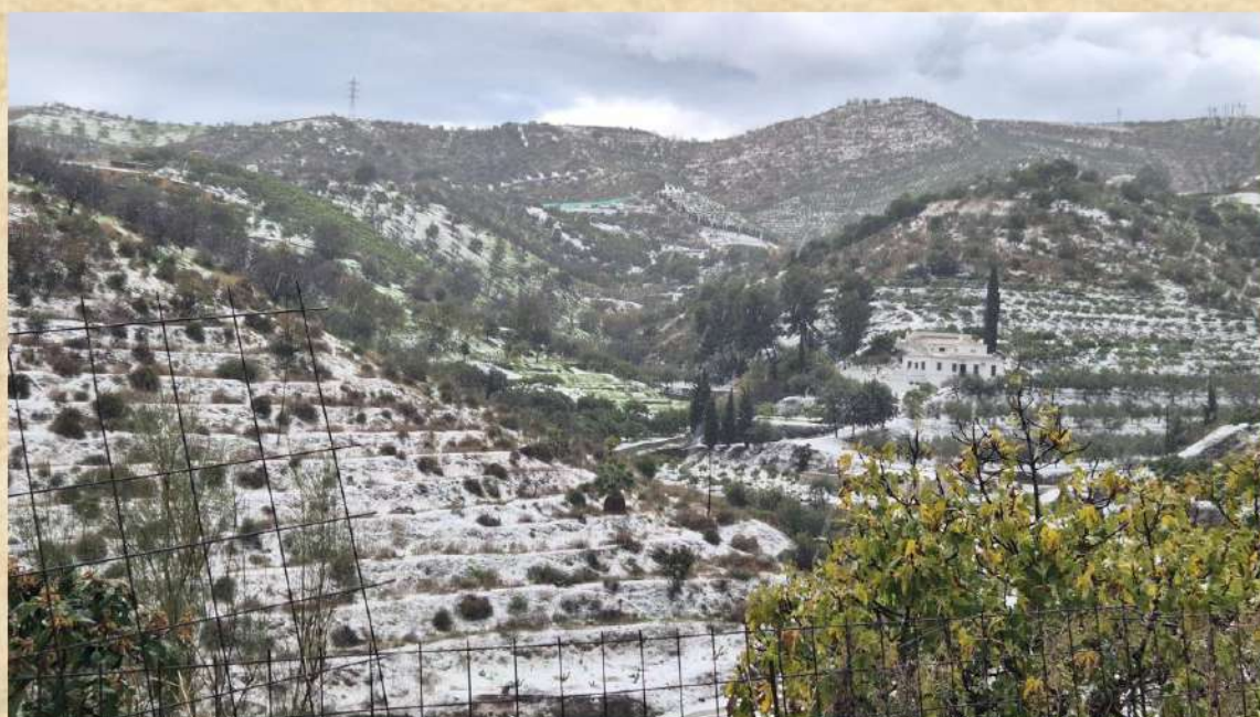
Montes de alrededores de Benagalbón.