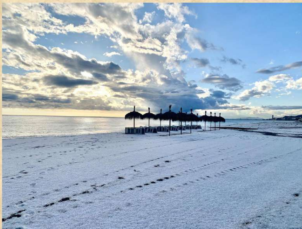
Un manto blanco cubre la playa de Rincón de la Victoria tras la histórica granizada