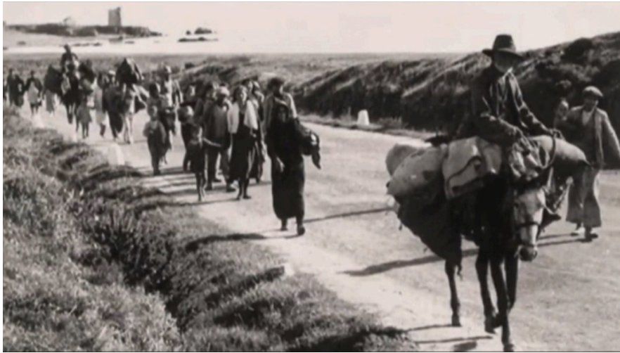
Malagueños en Desbandá. Un episodio oscuro de la historia española. RTVE

Al cabo de una semana caminando por el asfalto —o monte a través, para evitar el fuego de los cruceros— llegaron a Almería, donde, según contaba mi abuela, la recogieron junto a su madre en un camión y la llevaron a Valencia. Pasaría el resto del conflicto en unos barracones para los trabajadores del arroz, situados en la playa de la Malvarrosa, junto a otras familias caleñas. Recuerdo con claridad cómo contaba que lo único que había para comer eran batatas, las cuales, por supuesto, años después —y conmigo ya en el mundo— aborrecía.