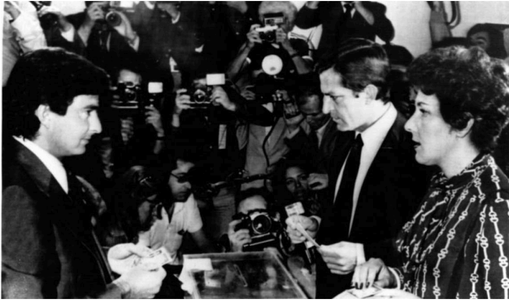
Adolfo Suárez y su esposa, Amparo Illana, votan en las primeras elecciones de 1977