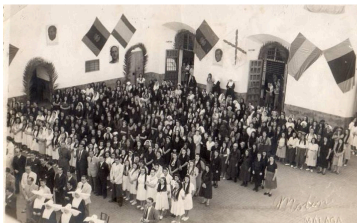
Imagen de las reclusas reunidas en el patio de la cárcel.

A través de encuestas sobre sexualidad y religión, Vallejo-Nájera intentó justificar su absurda tesis pseudocientífica —y profundamente misógina— de que las mujeres republicanas eran “degeneradas” por naturaleza. Este experimento, financiado por el régimen, revela hasta qué punto la represión franquista buscó no sólo castigar, sino también deshumanizar a quienes consideraba una amenaza.