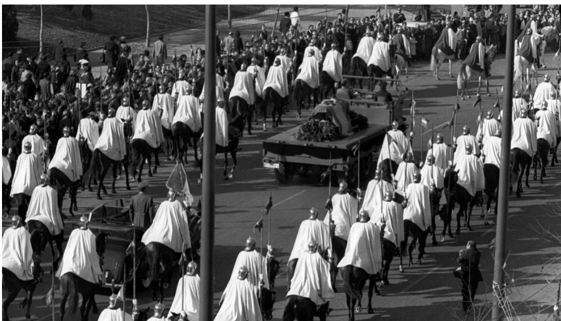
Traslado de los restos de Franco desde el Palacio Real al Valle de los Caídos en 1975.

Esta fecha es considerada por muchos historiadores como el inicio de un proceso inédito en la historia contemporánea de España: la vuelta de la monarquía y la democracia tras casi 40 años de dictadura. Algunos lloraron, otros celebraron. Pero realmente, al igual que en la guerra, ¿la dictadura había terminado, o seguimos siendo herederos directos de esos sucesos?