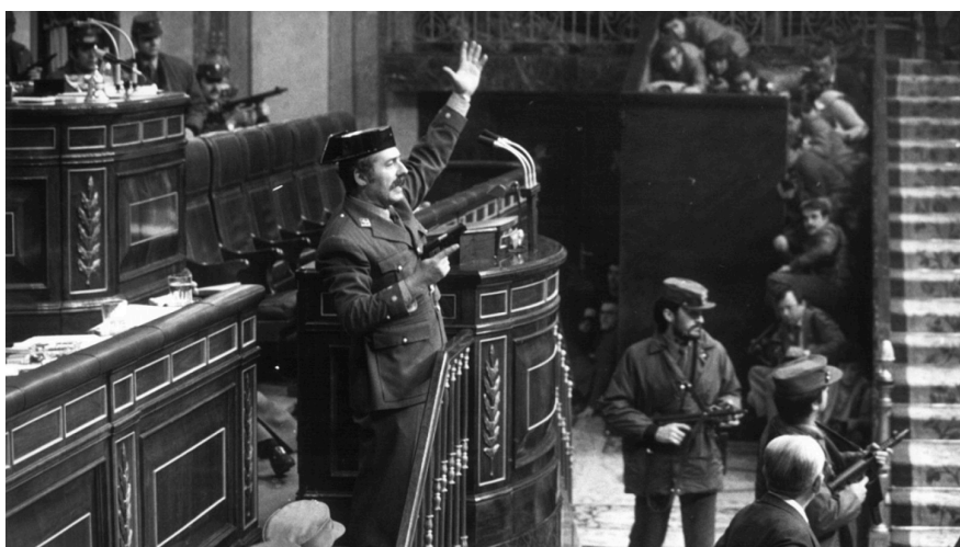
El teniente coronel Antonio Tejero irrumpe en el congreso a tiros. 23 de febrero de 1981

Con estas líneas, deseo no solo rendir homenaje a quienes vivieron en primera persona aquellos tiempos convulsos, sino también reivindicar el valor de la memoria y la necesidad de conservarla. Porque solo conociendo de dónde venimos, podremos comprender y defender con mayor firmeza lo que hoy somos.