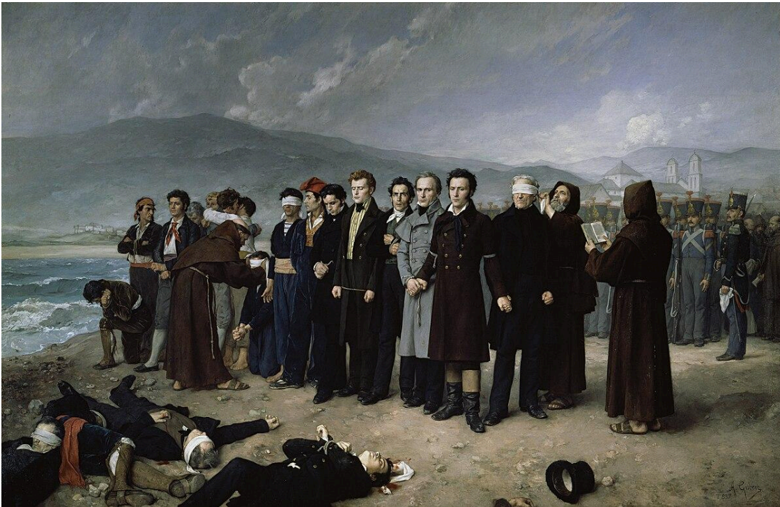
Fusilamiento de Torrijos y sus compañeros en las playas de Málaga. Antonio Gisbert, 1888. Óleo sobre lienzo. Museo del Prado, Madrid.

Cuando el gobierno encargó esta obra a Gisbert en enero de 1886, le indicaron que debía ser “ejemplo de la defensa de las libertades para las generaciones futuras” . En cierto modo, así ha sido.