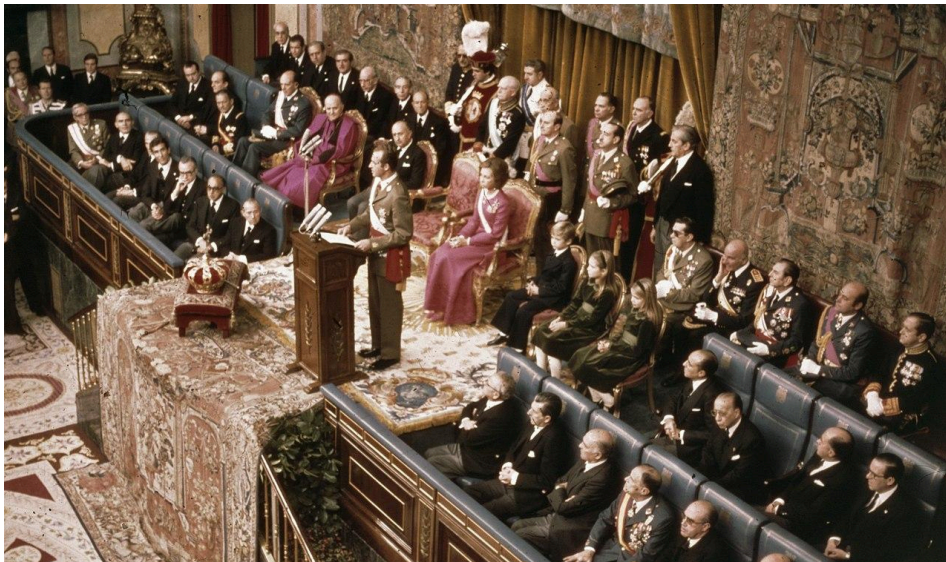
Acto de proclamación como rey ante las Cortes. Imágenes del Congreso de los diputados.

Comenzaba así el periodo de la Transición