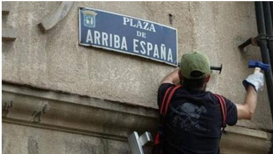
Operario retirando la placa de "Plaza de Arriba España", medida relacionada con la Ley de Memoria Histórica en España.