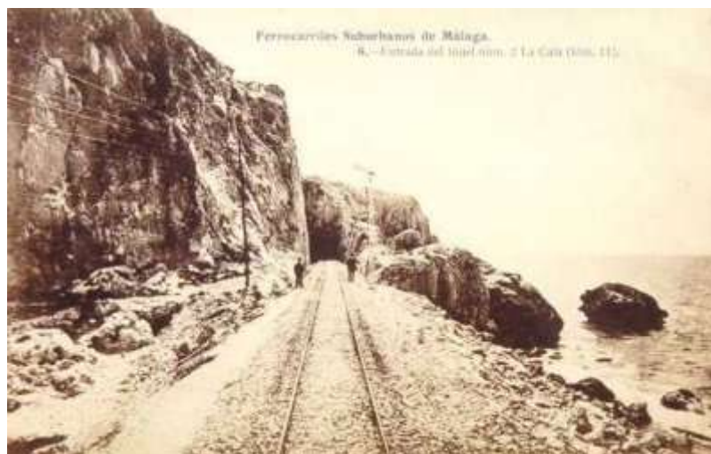
Túnel construido en 1907 para el paso del tren. En él se refugiaron los civiles que iban a Almería, y que fue bombardeado.