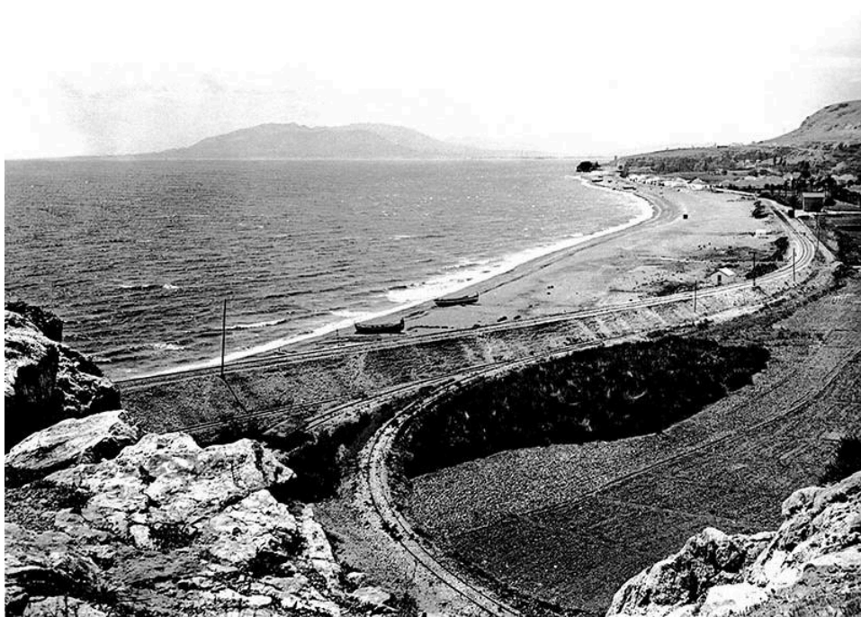
Fotografía del pueblo pesquero de La Cala Del Moral (Málaga), a vista desde El Cantal, alrededor de la década de 1930. Archivo fotográfico

Esta es la historia que nos acontece. La historia de una España dividida. La historia de una élite militar y política que actuó sin tener en cuenta a la población de un país que, en ese entonces, contaba con casi veinticinco millones de habitantes. El escritor malagueño Antonio Soler, en su reciente obra El día del Lobo (2024), aborda magistralmente este tema, contando precisamente lo que yo pretendo narrar en la introducción de este texto: la historia de su familia. Quizá haya algo de inspiración proveniente de la obra mencionada.