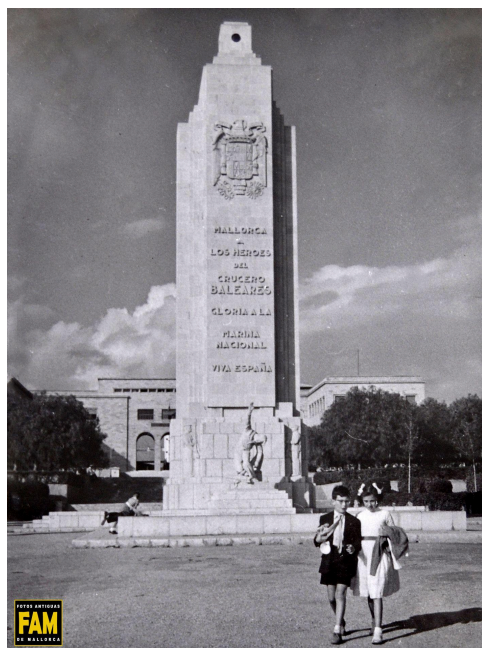
El monumento de sa Feixina en una fotografía de 1955, cuando conservaba las referencias a los "héroes" del crucero Baleares.

El caso del Baleares no es anecdótico sino un recordatorio vivo de cómo los símbolos del pasado siguen marcando la batalla ideológica del presente.